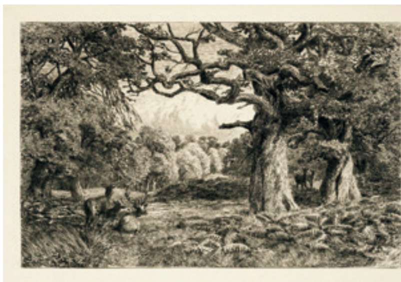
Ardennerskogen av John Macpherson, fra 1889.

rien: Det var få mennesker som forutså at Berlin-muren og Øst-Europa i 1989 ville bli frigjort fra sovjetisk dominans i løpet av noen få uker. Endringene var ikke planlagte. Det var en hel rekke forskjellige omstendigheter som gjorde omveltningene mulig. For en kort stund så det ut som om verden hadde gjort et nytt og viktig fremskritt. Dessverre varte det ikke. Nå 30 år senere ser det ut som om verden går baklengs inn i fremtiden. Men det kommer nye muligheter. Slik er det også i det enkelte menneskets liv. Har vi et åpent sinn og øynene åpne for tilfeldigheter – da skapes det også nye muligheter.