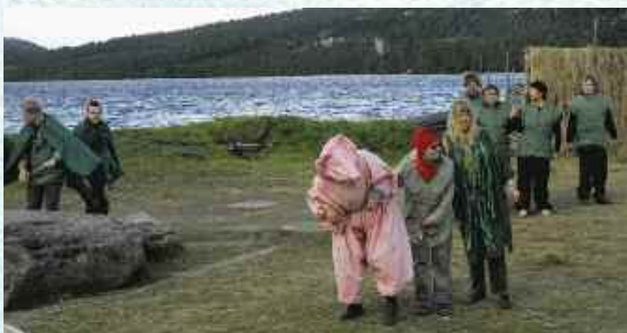
På kjøretøyet skal godtfolk kjennes.

de ved, hva det hele handler om. Af aktivitetene har de deltageret i musikk og alle nyder samværet med de nye venner fra hele Norden. Der bliver knyttet kontakter – nogle af dem kan måske vise seg at blive varige.