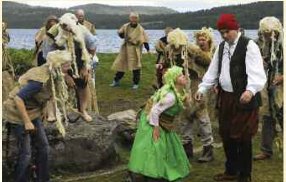
Peer hos Dovregubben.

Slik ble det, og sammen med Peer Gynt AS og flere nordiske teatergrupper med utviklingshemmede som en naturlig og viktig del av teatervirk-somheten, arrangerer nå Nordisk For-