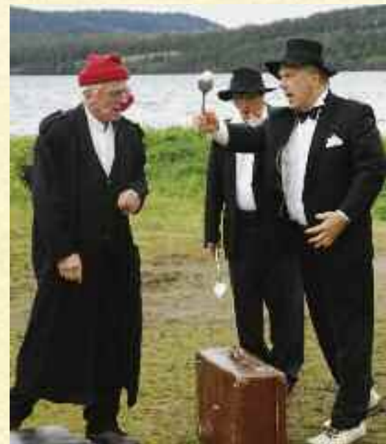
Peer møter Knappestøperen