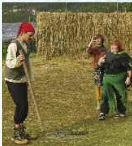
Den grønnkledde

De har dog forberedt seg ved at høre om Peer Gynt og hans liv, de har hørt sangene og gjennomgået teksten, så